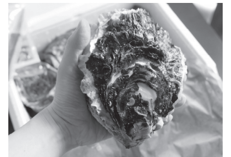
海の幸、山の幸が豊富で観光地としても人気

同市は、JR筑肥線の筑前前原駅周辺を「広域拠点」、波多江駅、糸島高校前駅周辺などを「地区拠点」として都市機能を集積し開発を進めている。池田や泊などの地域では市による土地区画整理や民間主導での住宅開発が進み、25年