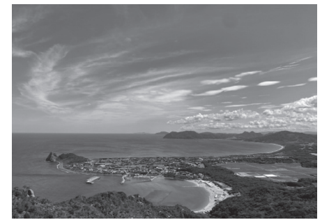
サーフィンやパラグライダーのスポット、海水浴場、ゴルフ場なども多く、レジャーを楽しめる

2021年度には、イギリスのビジネス&ライフスタイル情報誌「MONOCLE(モノクル)」で、「輝く小さな街」ランキング世界第3位に選ばれた。自然と都市の両環境に抜群のアクセスを持っていること、福岡県でも有数の農業都市で畜産業やオーガニック野菜が豊富なこと、外部者にもオープンなためビジネスの創造チャンスが多いことなどが評価された。こうした点が国内でも人気で、関東関西や遠方からの「ターナー」移住者も増えている。 人口推移を見ると、2016年度から右肩上がりが増え続けている。「第2次糸島市長期総合計画(21年度から30年度)」では、30年度の人口を10万4000人と